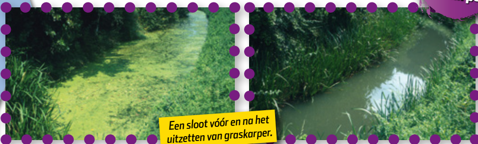
Een sloot vóór en na het uitzetten van graskarper.

Bekijk op Stekkie.nl de filmpjes over graskarper!