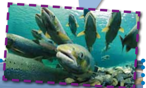
Brakke overgangszone bij de Haringvlietsluizen.

Trekvissoorten als de aal, zalm, bot, driedoornige stekelbaars en fint kunnen zowel in zout als zoet water leven. Dankzij aanpassingen van het lichaam kunnen zij vanuit een rivier de zee op zwemmen en andersom. De overgang naar een ander zoutgehalte is wel even wennen. Daarom is de brakke overgangszone tussen het zoete rivierwater en het zoute zee water erg belangrijk. Als de vissen heel abrupt van zoet naar zout water zouden zwemmen (of andersom), dan zouden ze dat niet overleven.