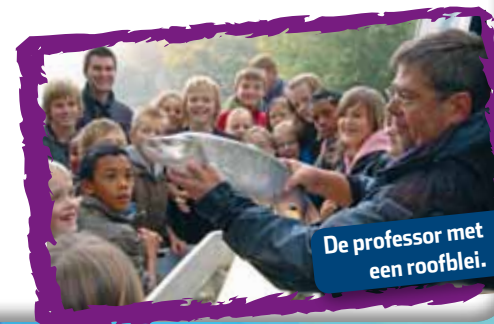
De professor met een roofblei.

Sommige soorten vind je vrijwel alleen in stromend water. Meestal zijn de eitjes van deze soorten afhankelijk van zuurstofrijk water, dat continu met de stroming wordt aangevoerd. Echte stromend water vissen zijn bijvoorbeeld barbeel, kopvoorn en serpeling. Deze soorten kun je vangen in beken en rivieren. Soorten die voor de voortplanting stromend water nodig hebben maar daarna ook in stilstaand water kunnen leven zijn bijvoorbeeld winde en roofblei. Deze soorten vang je in de rivieren maar ook in stilstaand water, dat rechtstreeks of via een sluis of gemaal met een rivier in verbinding staat.