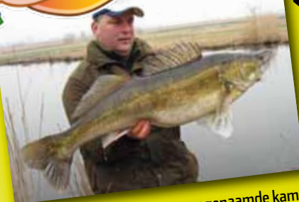
licht. Op de huid liggen zogenaamde kamschubben, waardoor het lichaam ruw aanvoelt. In ons land kan snoekbaars een maximale lengte bereiken van 120 centimeter bij een gewicht van 25 tot 30 pond.

De snoekbaars heeft een langgerekt lichaam met een van boven afgeplatte, spits toelopende kop. In de bek bevindt zich een groot aantal scherpe tandjes, met aan de voorzijde enkele grotere vangtanden. De vis is zilverkleurig aan de buikzijde en grijs tot groengrijs op de rug. De snoekbaars heeft twee gescheiden rugvinnen, waarvan de voorste steekels bezit. De ogen hebben een speciale reflecterende laag op het netvlies, waardoor de vis goed kan zien bij weinig licht. Op de huid liggen zogenaamde kamschubben, waardoor het lichaam ruw aanvoelt. In ons land kan snoekbaars een maximale lengte bereiken van 120 centimeter bij een gewicht van 25 tot 30 pond.