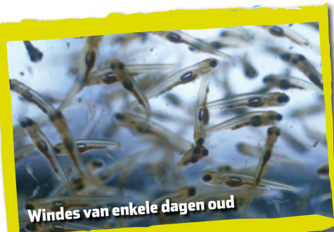
Windes van enkele dagen oud

De winde leeft vooral in grote, open wateren en de zijtakken daarvan. De soort kan na uitzetting prima in stilstaand water leven, maar voor de voortplanting is stromend water vereist. In de herfst verzamelen de vissen zich in de benedenloop van kleine rivieren en beken die in grote wateren uitmonden. Aan het eind