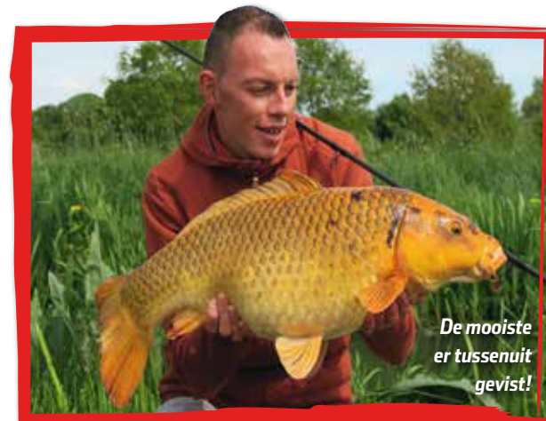
De mooiste er tussenuit gevestig!

van het wateroppervlak en ontdek je de vissen sneller. Als je de karpers ziet liggen of zwemmen, is er een kans dat je ze kunt vangen. En als je echt je best doet, kun je zelfs gericht de mooiste vissen er tussenuit vangen. Ga pas voeren en vissen als je karpers hebt gespot. Dat is veel effectiever dan op goed geluk wat brokken strooien, terwijl de karpers met zijn allen helemaal aan de andere kant van de sloot zwemmen. Zoeken = vinden. En voor wie vervolgens koel blijft, geldt: vinden = vangen. Succes!